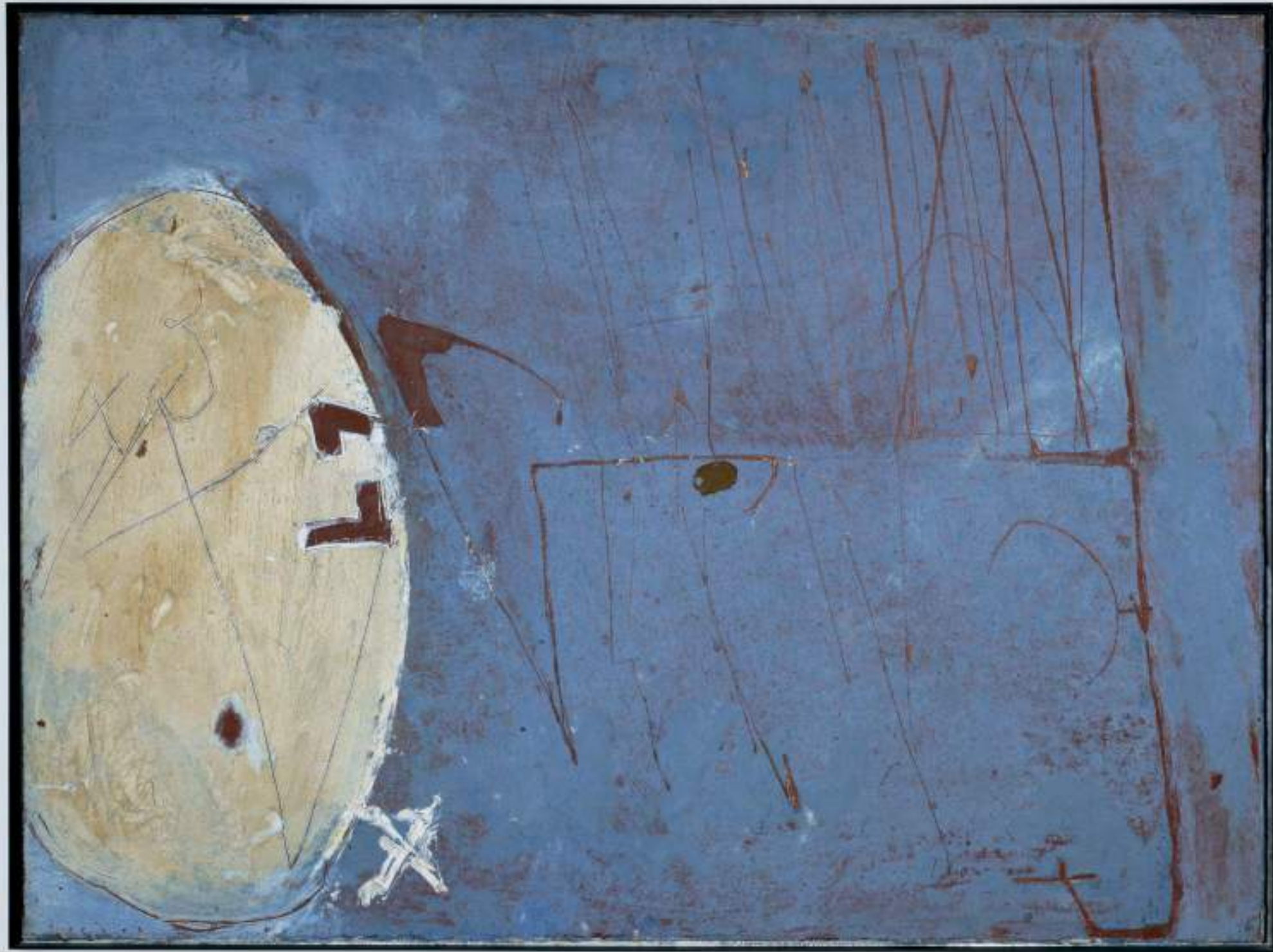
Antoni Tàpies, Pintura en blau , 1955