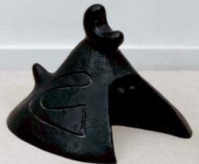
Joan Miró, Dona , 1949