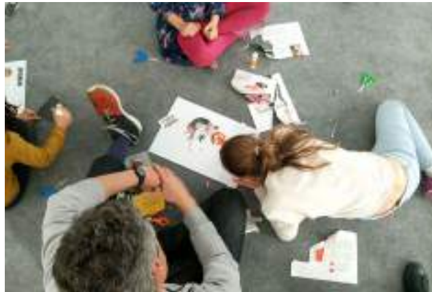
La Fundació Glòria Soler y la Fundació Suñol se complementan de manera estratégica y trabajan conjuntamente para difundir el arte contemporáneo y acercar sus valores a la sociedad