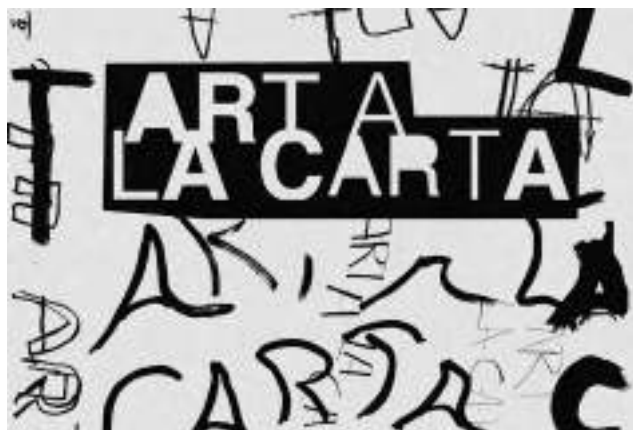
Gráfica para la difusión de ARTE A LA CARTA