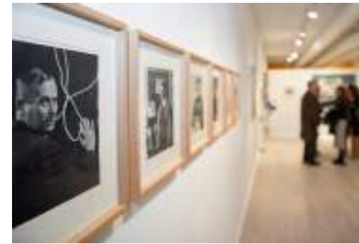
Sede de la Fundació Suñol y Fundació Glòria Soler