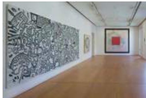
Passeig de Gràcia, obras de Luis Gordillo y José María Sicilia