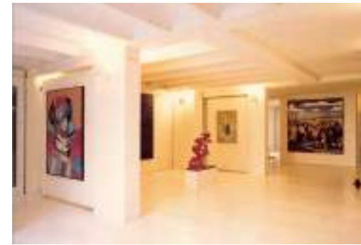
Galería 1, con obras de Luis Gordillo, Giacomo Balla, Darío Villalba y Equipo Crónica