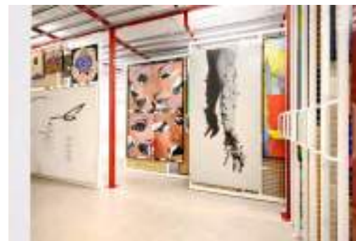
Vista de la nueva reserva de la Colección