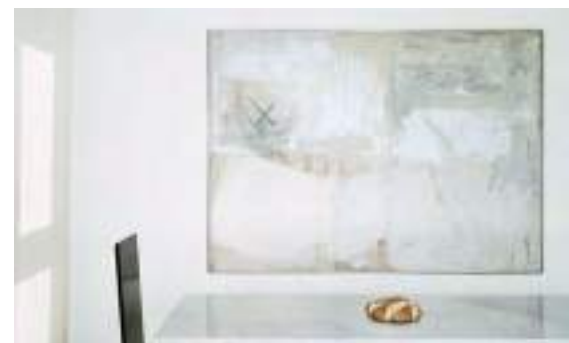
Gastone Novelli, Più inutile , 1958 Claudio Bravo, Pan tostado , 1974