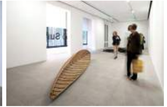
Exposición Susana Solano. Vol rasant . Edificio del Passeig de Gràcia

La cuarta etapa (2007-2019) empieza con la apertura de la Fundación Suñol al público el 21 de mayo de 2007 y llega hasta el 12 de enero de 2019. En los 12 años de actividad en su sede de Passeig de Gràcia 98, la Fundación ha alcanzado un papel fundamental en el panorama cultural de Barcelona. La organización de cerca de un centenar de exposiciones avala este recorrido, así como la asistencia de más de 100.000 visitantes a sus exposiciones y actividades. En 2015 se crea la Fundación Glòria Soler Elías con la finalidad de promover y apoyar programas de carácter social y filantrópico.