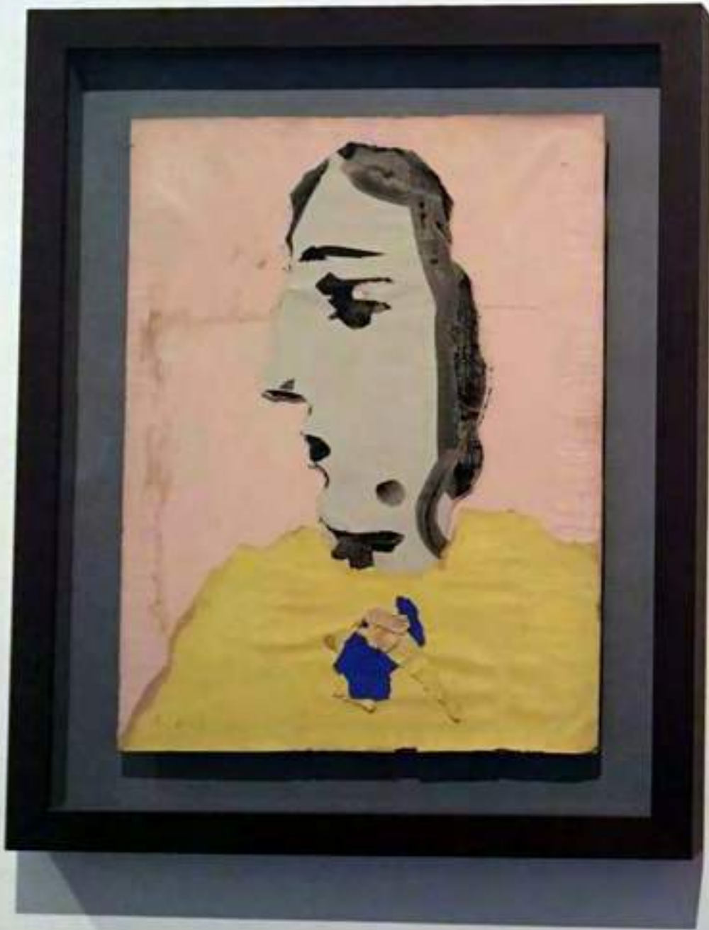
Pablo Picasso Busto de mujer con blusa amarilla, 1943. Collage sobre madera. 65 x 50 cm.