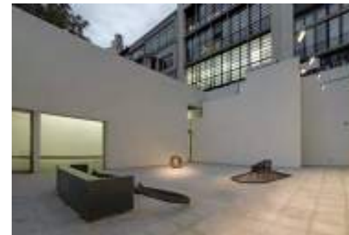
Vista del Nivell Zero y del edificio de Passeig de Gràcia, obras de Sergi Aguilar, Arnaldo Pomodoro y Susana Solano

La cuarta etapa (2007-2019) empieza con la apertura de la Fundación Suñol al público el 21 de mayo de 2007 y llega hasta el 12 de enero de 2019. En los 12 años de actividad en su sede de Passeig de Gràcia 98, la Fundación ha alcanzado un papel fundamental en el panorama cultural de Barcelona. La organización de cerca de un centenar de exposiciones avala este recorrido, así como la asistencia de más de 100.000 visitantes a sus exposiciones y actividades. En 2015 se crea la Fundación Glòria Soler Elías con la finalidad de promover y apoyar programas de carácter social y filantrópico.