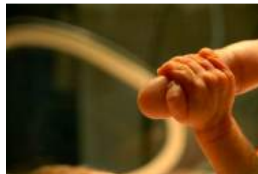
Unidad de Cuidados Paliativos Pediátricos del Hospital Sant Joan de Déu