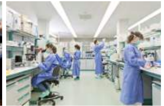
El avance en la investigación de la vacuna terapéutica contra el VIH/sida, y en el ámbito de microbioma del Instituto IrsiCaixa

La Fundación Glòria Soler también impulsa programas solidarios, innovadores y de gran impacto social en los ámbitos científico, social y humanístico, en colaboración con entidades de reconocido prestigio y trayectoria.