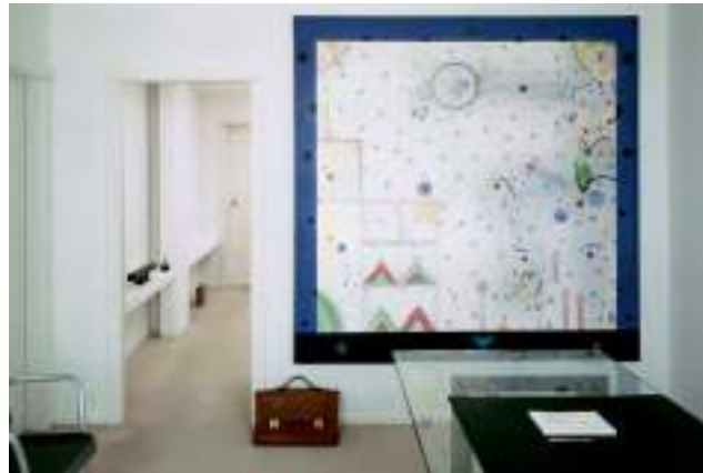
Zush, Jude, 1972. Colección Suñol Soler. Les Escalles