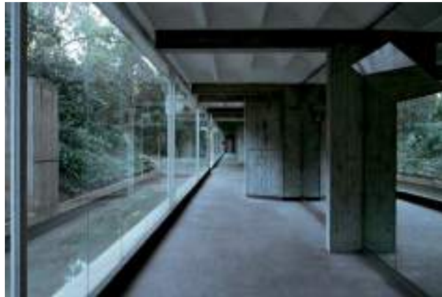
Les Escapes, vestíbulo