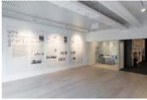
Fundación Suñol / Fundación Glòria Soler. Interior: sala polivalente, despacho, biblioteca

En la quinta etapa , iniciada en 2019 , la Fundación Suñol se emplaza en el espacio histórico de la Galería 2, completamente reformado con los últimos estándares de preservación de los fondos artísticos, y pretende ampliar su ámbito de acción con el desarrollo y la implementación de nuevos programas, colaboraciones y sinergias que suman otros objetivos a los ya marcados desde su creación.