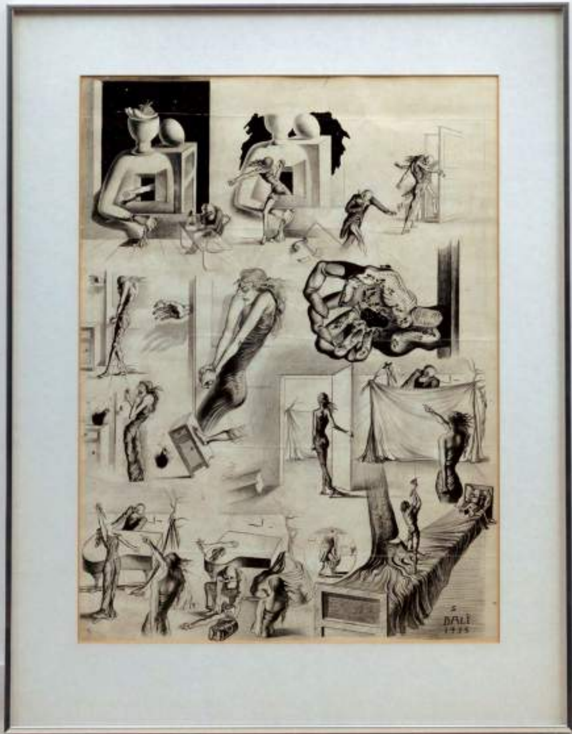
Salvador Dalí, Studies for the Script for the Film 'Les Mystères Surréalistes de New York' , 1935