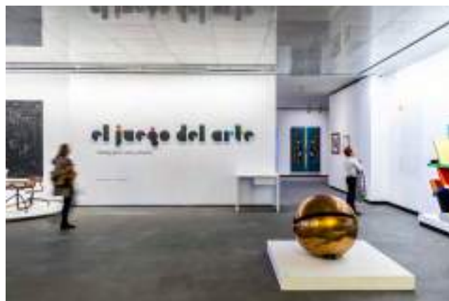
El juego del arte. Pedagogías, arte y diseño. Fundación Juan March, Madrid