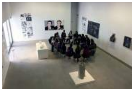
Actividad educativa realizada en la Fundació Suñol con la colaboración de la Fundació Glòria Soler