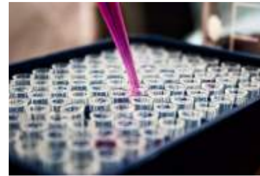
Terapia CART (Chimeric Antigen Receptor T) y apoyando al Hospital Clínic de Barcelona en su Proyecto ARI