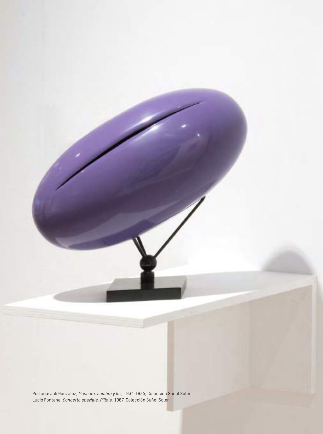
Portada: Juli González, Máscara, sombra y luz , 1934-1935, Colección Suñol Soler Lucio Fontana, Concetto spaziale. Pillola , 1967, Colección Suñol Soler