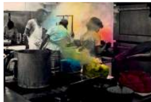
Preparativos en Semon del catering para la fiesta ritual "Situació Color", organizada por Miralda y Jaume Xifra