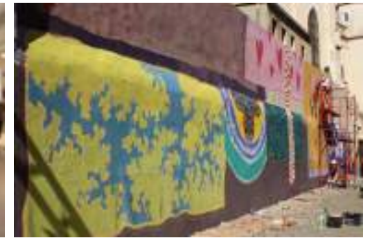
Colaboración con Torrents d'Art, un programa innovador impulsado por el Área de Salud Mental del Parc Sanitari Sant Joan de Déu y la Obra Social Sant Joan de Déu