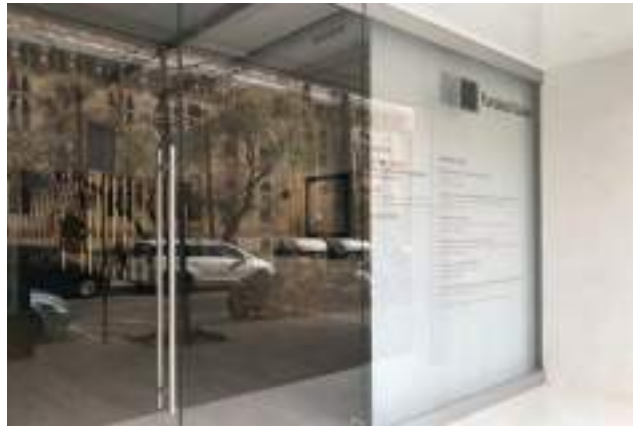
Fundación Suñol / Fundació Glòria Soler. Calle Mejía Lequerica 14, Barcelona