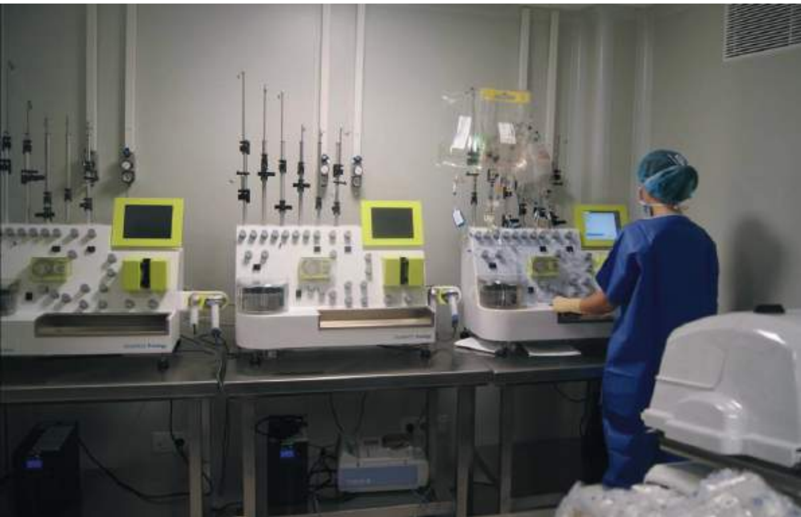
Clinimacs Prodigy. Hospital Clínic de Barcelona