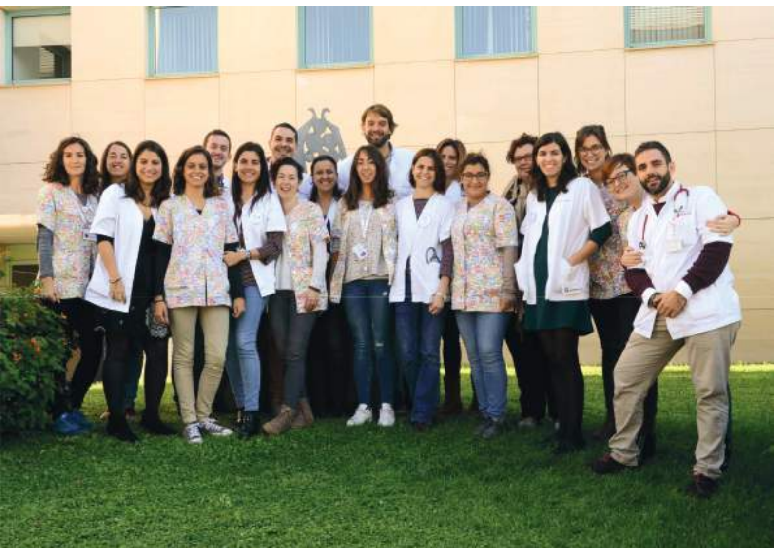
Equip de la Unitat de Cures Pal·liatives Pediàtriques de l'Hospital Sant Joan de Déu