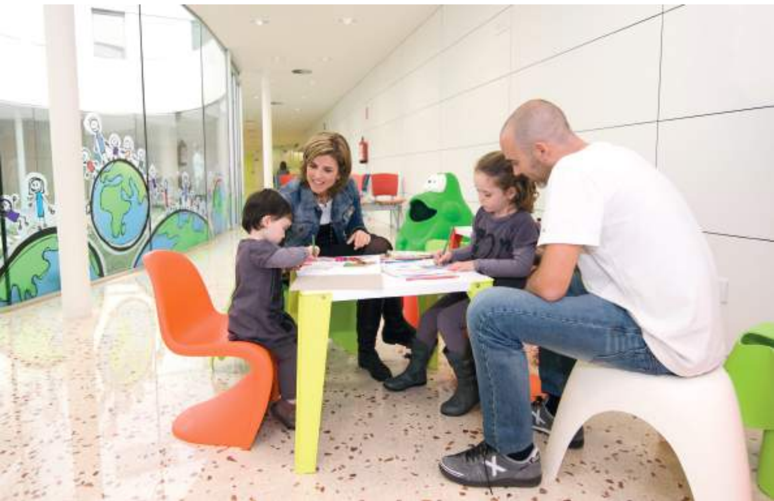
Centro de atención pediátrica integral Barcelona Esquerra. Hospital Sant Joan de Déu de Barcelona