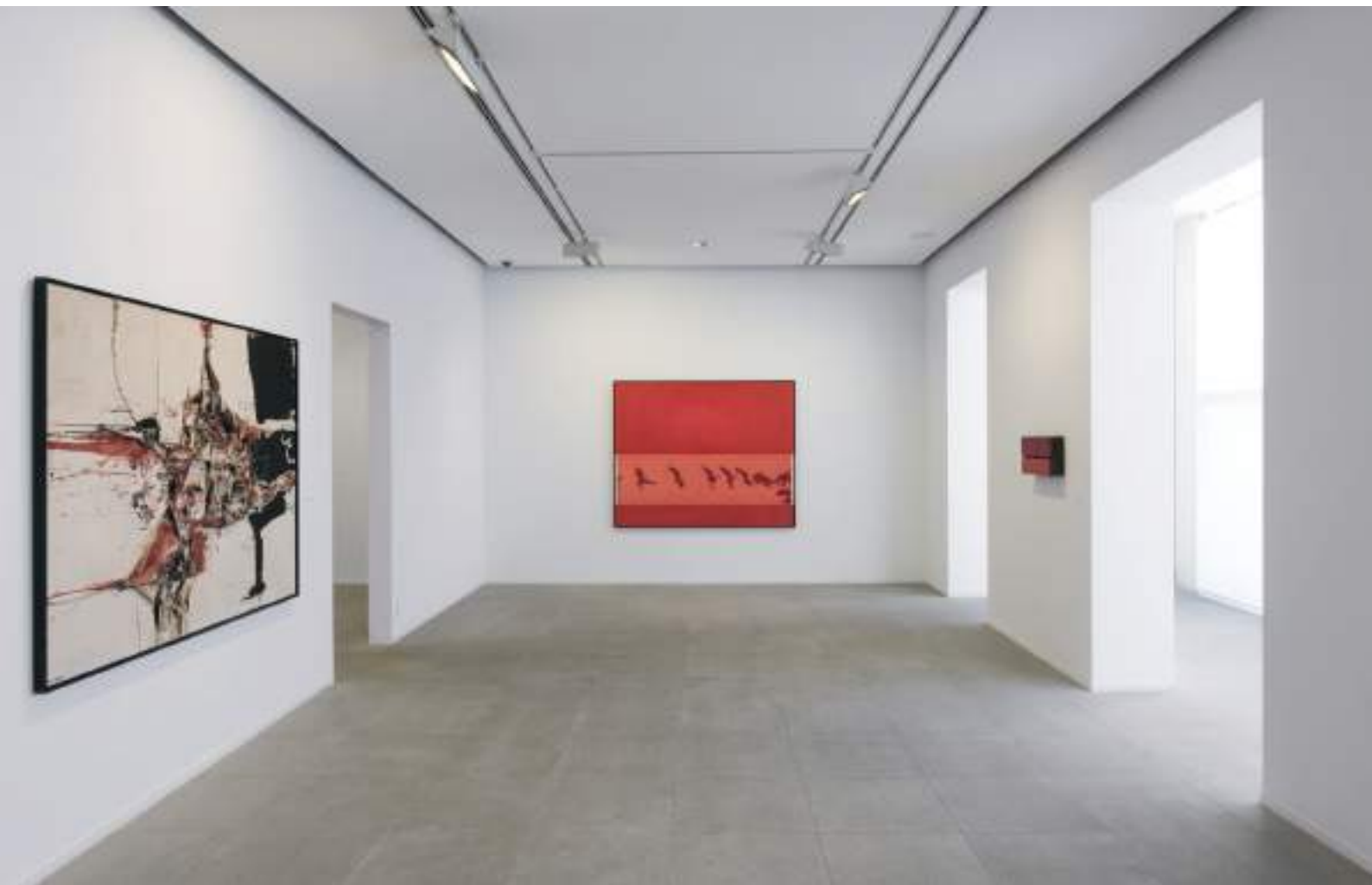
Vista de las salas de la Fundació Suñol.