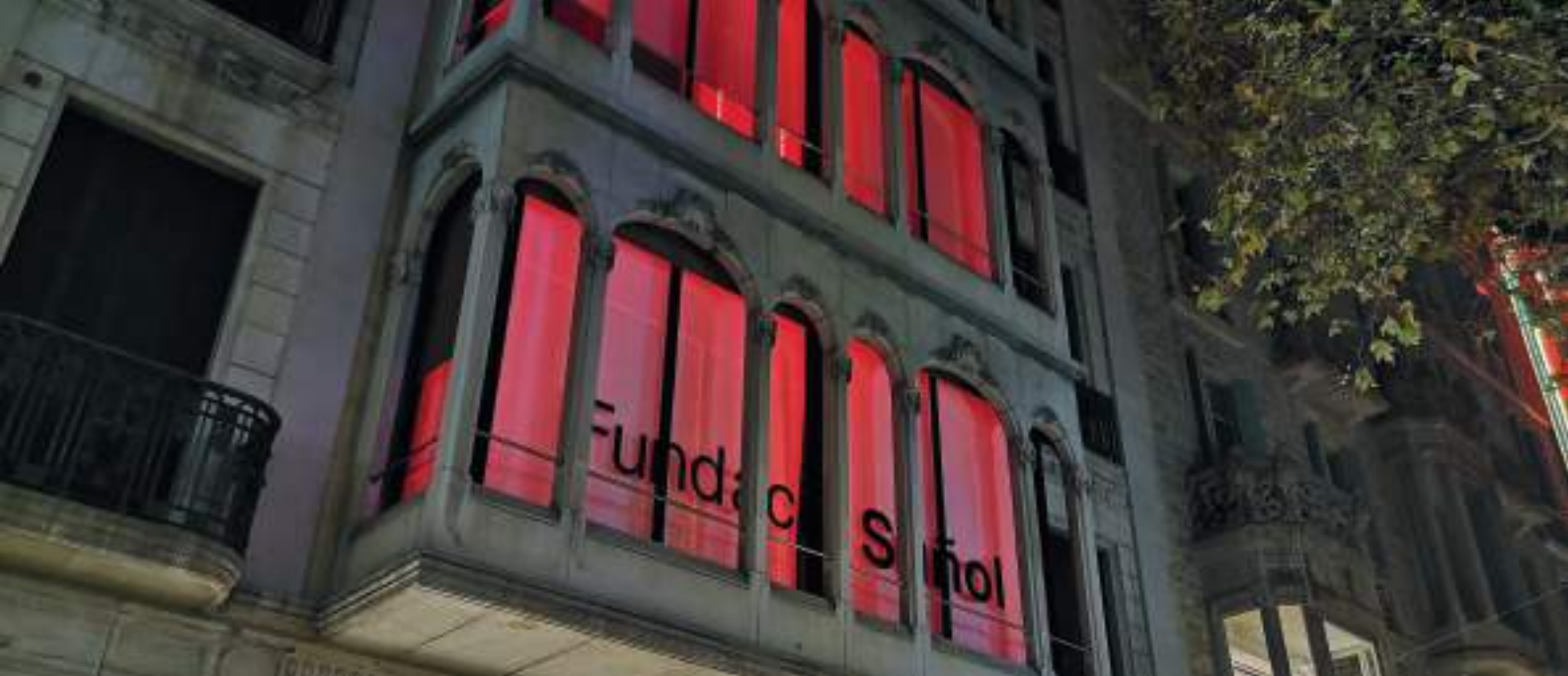
Fachada de la Fundació Suñol iluminada de rojo en adhesión a la campaña del Día Mundial de la Lucha contra el Sida