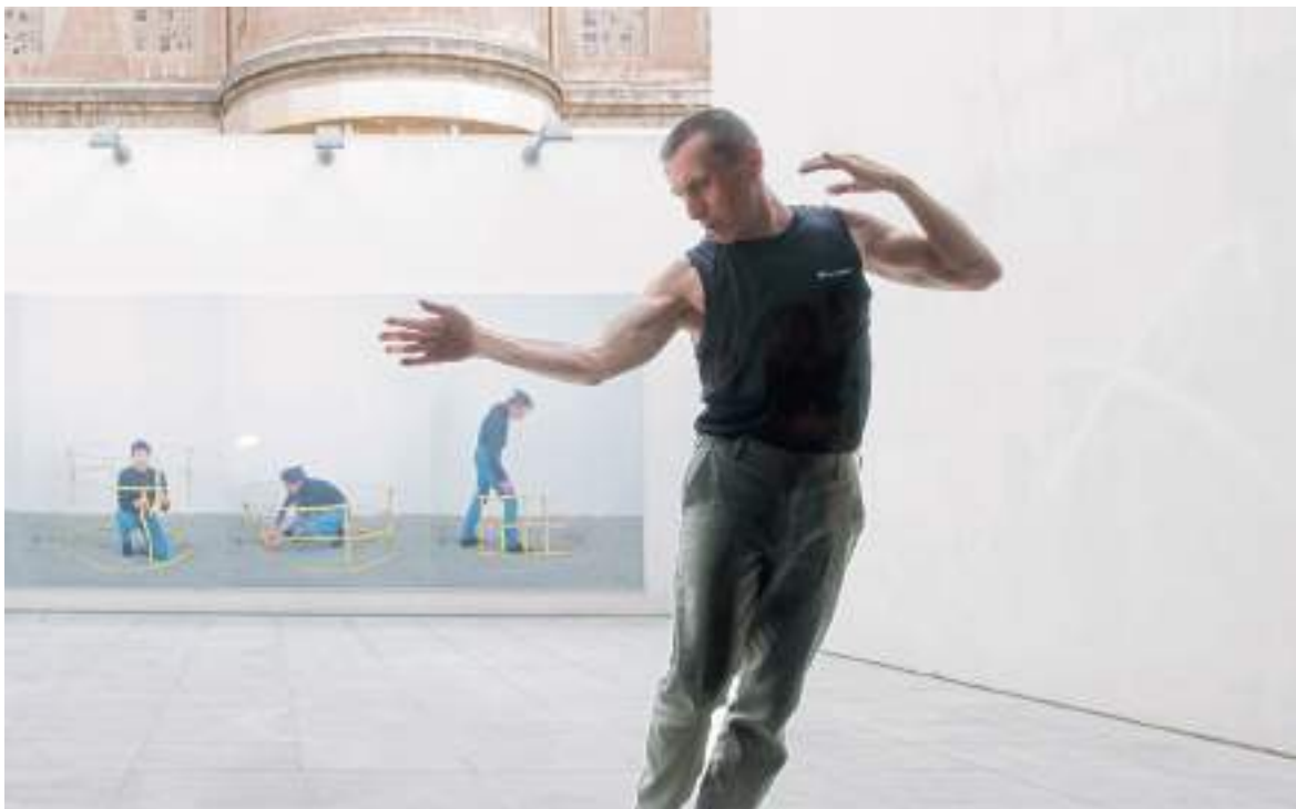
Performance Dimensiones variables a cargo de Joan Casaoliva Fundació Suñol.