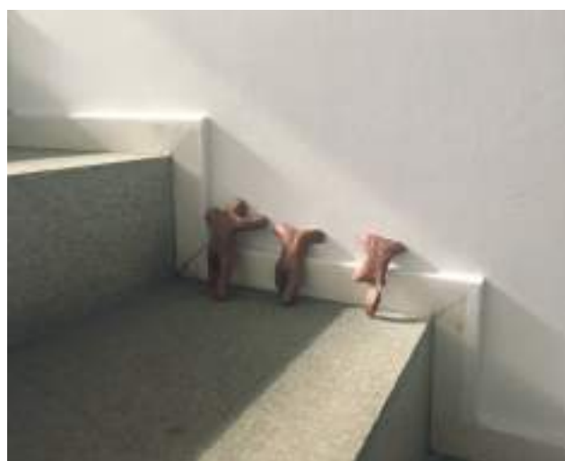
Intervención en el ACTE 40: Sinéad Spelman . Proyecto Divers Format. Fundació Suñol