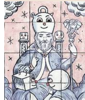
'El papa', de Sergio Mora.