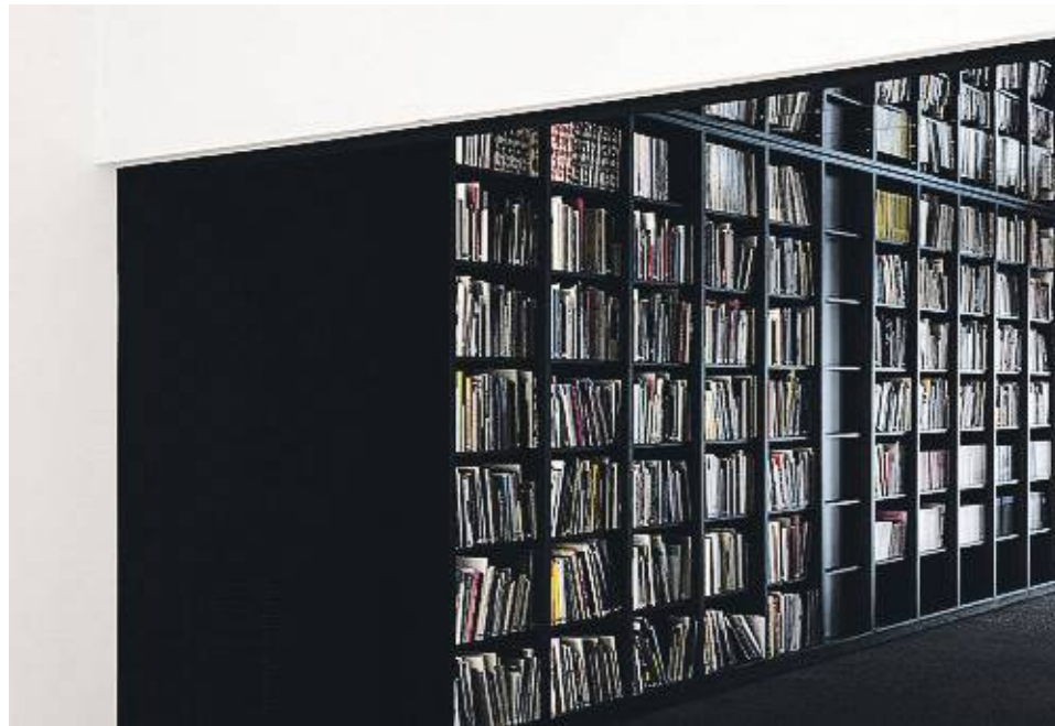
La biblioteca de la nova seu de la Fundació Suñol, al carrer de Mejía Lequerica.

La nova seu de la Fundació se situa a la històrica Galeria 2 , que havia estat magatzem de la col·lecció i havia acollit algunes exposicions privades,