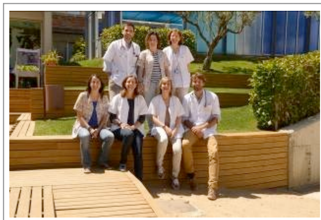
Parte del Equipo del Hospital Sant Joan de Déu